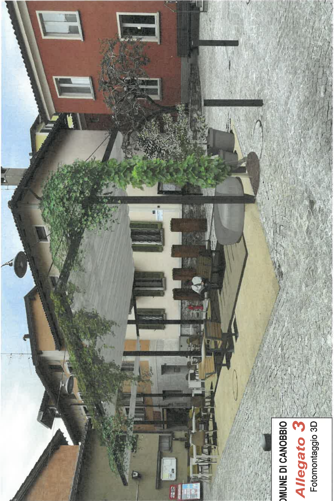
COMUNE DI CANOBBIO Allegato 3 Fotomontaggio 3D