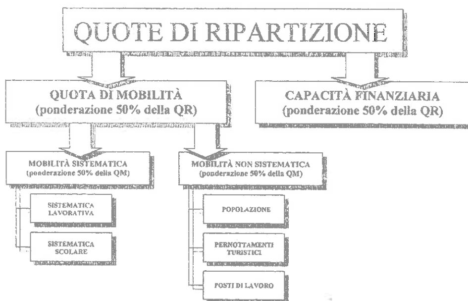
Figura 2 Costruzione della chiave di ripartizione intercomunale PTL

Il meccanismo prevede l'aggiornamento costante della chiave di riparto, a scadenze triennali, in funzione dell'evoluzione dei parametri statistici utilizzati per il calcolo.